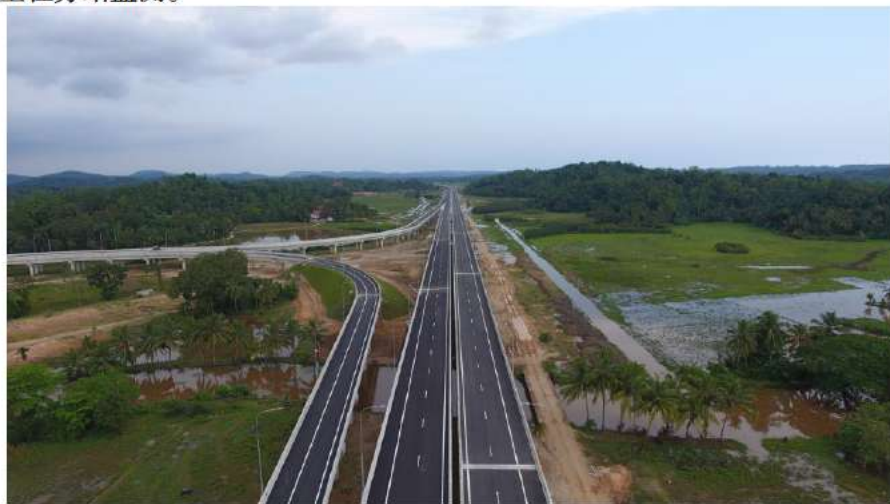
南部高速延长线项目第一标段

【工程质量标准、验收及免责规定】斯里兰卡工程质量标准主要执行英国标准，也可适用国际公认的欧洲标准，个别项目合同规定可使用中国规范，但应符合国际标准要求。一般工程项目无免责条款（除不可抗力因素外）。验收按单位工程、分部工程、分项工程、单元工程、检验批次等方式进行验收。重要隐蔽工程、检验实验、测量、特殊工序等监理工程师全程旁站监测。