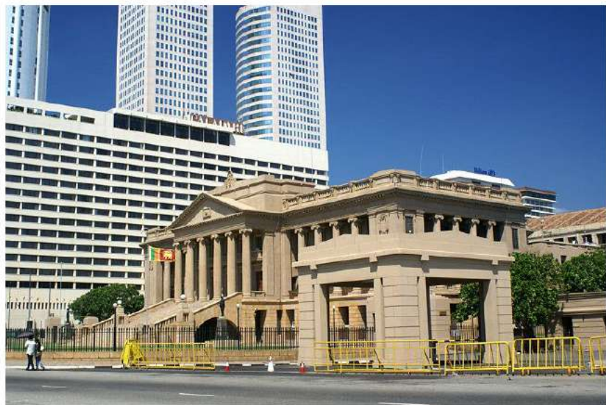
总统秘书处办公楼

【总统】总统为国家元首、政府首脑和武装部队总司令，享有任命总理和内阁成员的权力。现任总统为戈塔巴雅·拉贾帕克萨，于2019年11月8日宣誓就职，任期5年。