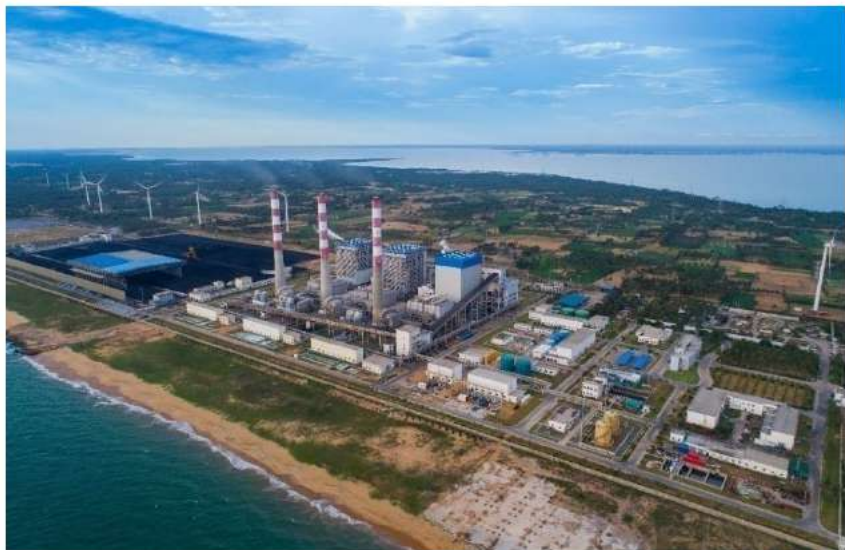
普特拉姆燃煤电站

由中国提供贷款建设的普特拉姆燃煤电站是斯里兰卡目前唯一一个燃煤电站项目。该电站一期一台300MW机组于2011年5月建成发电，二期两台300MW机组于2014年10月建成发电。普特拉姆燃煤电站装机容量占斯全国装机容量约22%。年发电量占全国用电量约37%，最高单日发电量占全国用电量67.8%。截止2020年4月底，三台机组总发电量372.41亿KW.h，净输出335.66亿KW.h，三台机组平均发电可利用率超过90%。