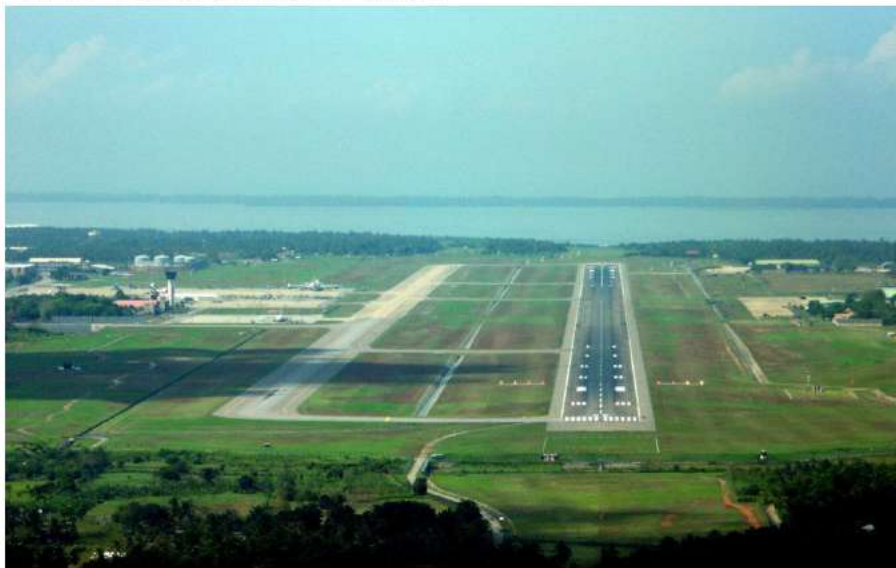
班达拉奈克国际机场

新冠肺炎疫情之前，中国国际航空公司执行成都至科伦坡直达航班，中国东方航空公司执行上海、昆明至科伦坡直达航班，中国南方航空公司执行广州至科伦坡航班，旅客可以搭乘中国民航班机，通过成都、上海、昆明、广州等口岸转机到达科伦坡；同时，斯里兰卡航空公司执行北京、上海、广州和昆明至科伦坡直达航班；旅客也可通过香港、曼谷、新加坡、马来西亚吉隆坡等地转机来科伦坡。