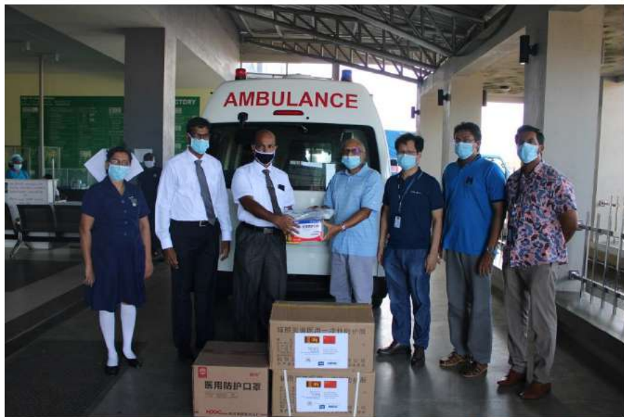
向汉班托塔地区总医院捐赠紧急医疗防护物资

截至目前，在中国政府经济技术援助项下，已经实施建成的和在建的各类项目116个。其中大型成套项目36个，已建成项目33个，主要有纪念班达拉奈克国际会议中心、高等法院大楼、国家艺术剧院等项目。正在实施项目3个，分别为国家医院门诊楼、波隆纳鲁沃国家肾内专科医院、康提水技术研究示范联合中心；提供单项设备和物资共46批，其中已完成项目43个，主要包括救灾物资、办公用品、医疗设备、体育器材等项目。截至2019年底，我在援款项下共为斯里兰卡培训各类人员近8000名，其中官员近6000名、技术人员和留学生近2000名，培训领域涉及公共管理与社会组织、党政、经贸、外交、教育、农林、交通运输和物流业、卫生和社会保障业、科学研究业、制造业等多个方面。