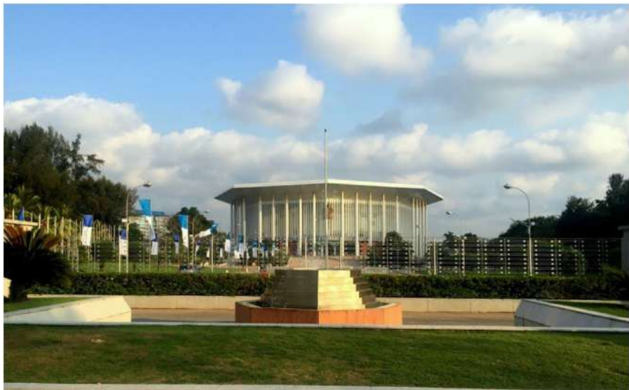
斯里兰卡纪念班达拉奈克国际会议大厦