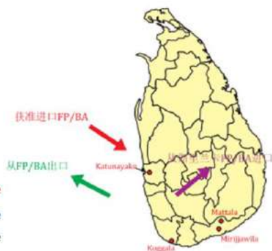
税港口和保税区区位分布图

西部和南部地区是斯里兰卡人口密集区，也是吸引外国投资的重点区域。斯里兰卡政府希望大力发展临港产业和工业园区建设，以提高斯里兰卡出口产能和产品附加值。具体政策遵循斯里兰卡投资局的鼓励政策。可参见3.2和斯里兰卡投资局网站（ www.investsrilanka.com ）。